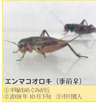
エンマコオロギ (手前♀)