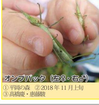
オンブバッタ(左♀・右♂)