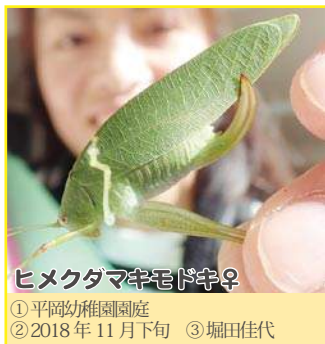
ヒメクダマキモドキ♀