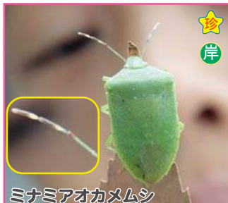
ミナミアオカメムシ