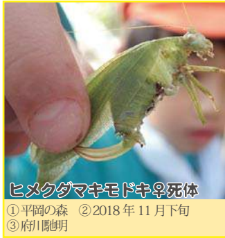
ヒメクダマキモドキ♀死体