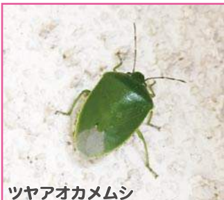
ツヤアオカメムシ