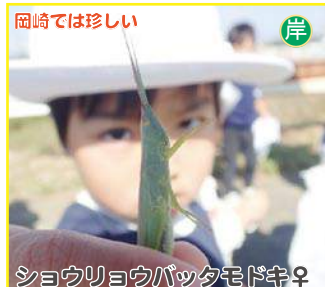
ショウリョウバッタモドキ♀