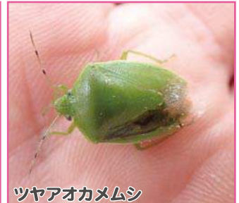
ツヤアオカメムシ