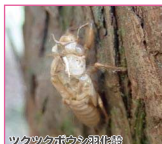
ツクツクボウシ羽化殻