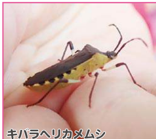
キバラヘリカメムシ