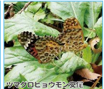
ツマグロヒョウモン交尾