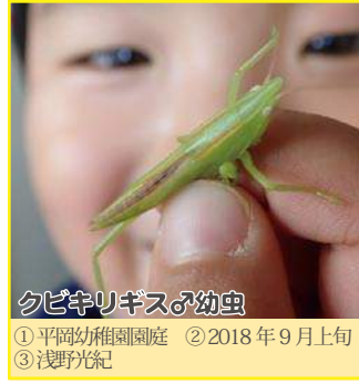
クビキリギス♂幼虫