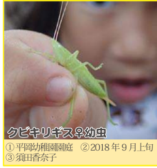
クビキリギス♀幼虫