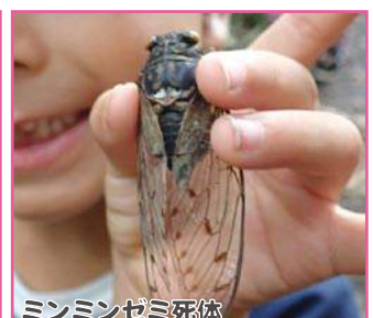
ミンミンゼミ死体