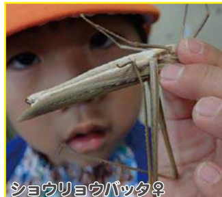
ショウリョウバッタ♀