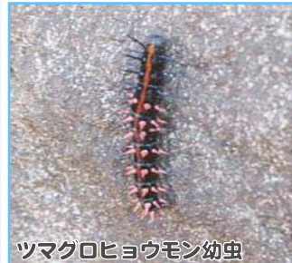
ツマグロヒョウモン幼虫