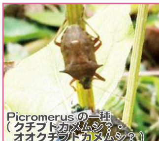
Picromerus の一種 (クチフトカメムシ? オオクチフトカメムシ?)