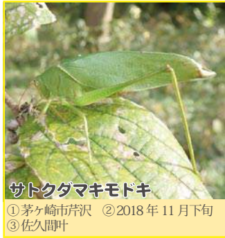
サトクダマキモドキ