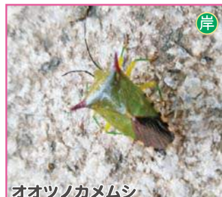
オオツノカメムシ