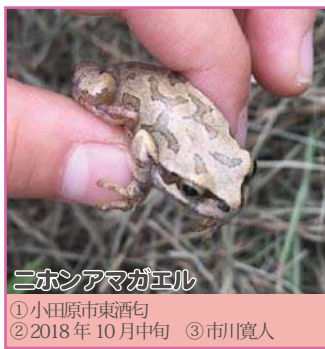
ニホンアマガエル