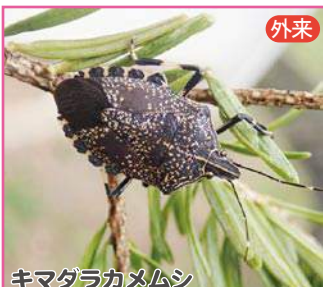
キマダラカメムシ