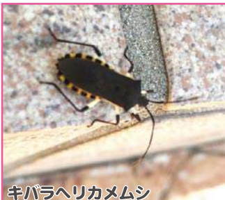
キバラヘリカメムシ