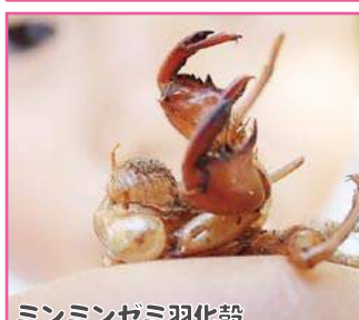
ミンミンゼミ羽化殻