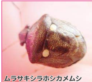
ムラサキシラホシカメムシ