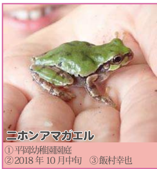
ニホンアマガエル