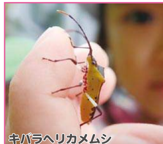
キバラヘリカメムシ