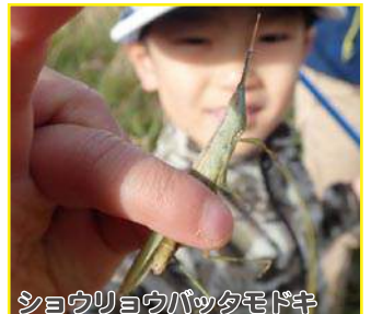
ショウリョウバッタモドキ