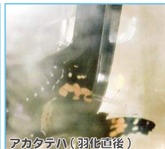
アカタテハ(羽化直後)