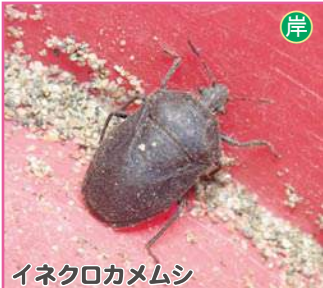
イネクロカメムシ