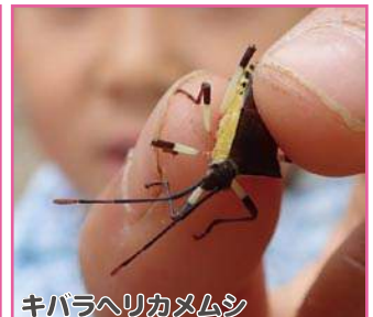
キバラヘリカメムシ