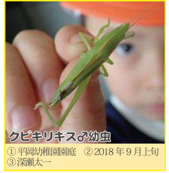
クビキリギス♂幼虫