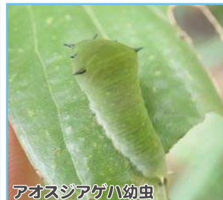
アオスジアゲハ幼虫