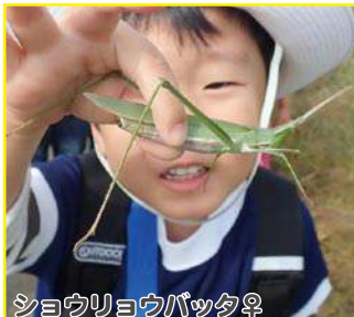
ショウリョウバッタ♀