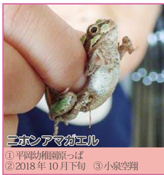
ニホンアマガエル