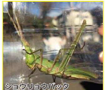
ショウリョウバッタ