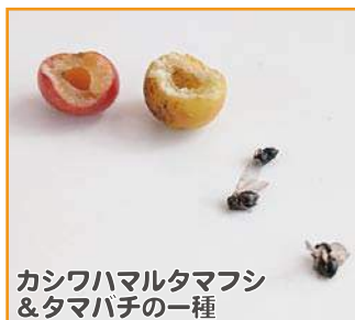
カシワハマルタマフシ & タマバチの一種