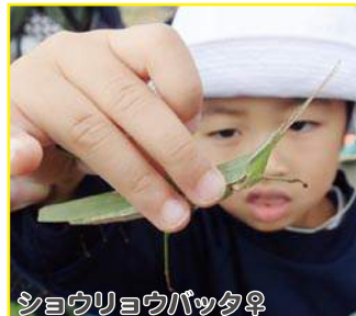
ショウリョウバッタ♀