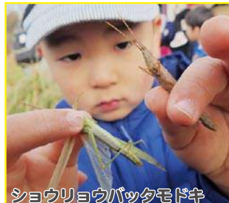
ショウリョウバッタモドキ