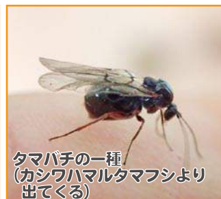
タマバチの一種 (カシワハマルタマフシより 出てくる)