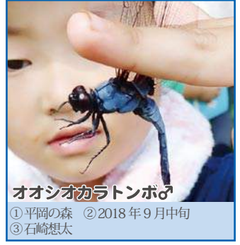
オオシオカラトンボ♂