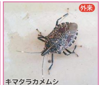
キマダラカメムシ