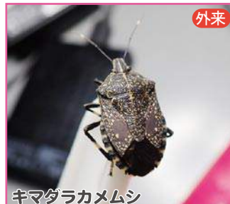
キマダラカメムシ