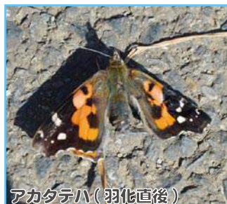
アカタテハ(羽化直後)