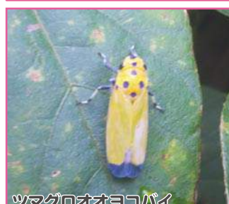
ツマグロオオヨコバイ