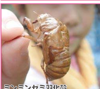
ミンミンゼミ羽化殻